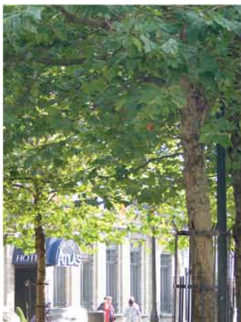
Vue du quartier