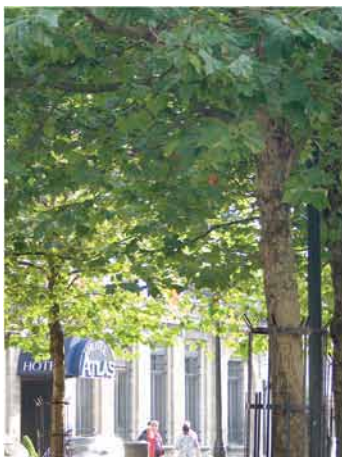
Vue du quartier