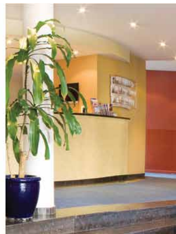
L'entrée - la réception